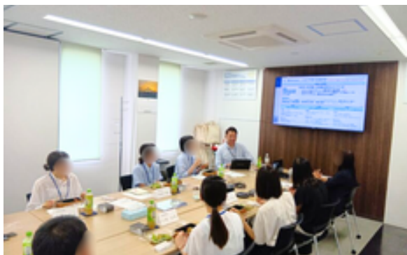
社員と交流する内定者のみなさん

2026年4月1日付で入社予定の新卒内定者に向けて、懇親会と職場見学会を行いました。工場見学や社員との交流を通じて会社理解を深め、入社後の自分を思い描く貴重な一日となりました。