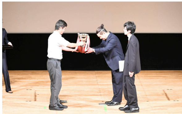
優勝杯を受け取るピアンコ・ネーロサークルのメンバー

7月30日、「QCサークル全社大会」を開催しました。社内56サークルから選抜された8サークルが改善事例を発表し、最優秀賞には厚原工場の『ピアンコ・ネーロサークル』が受賞しました。