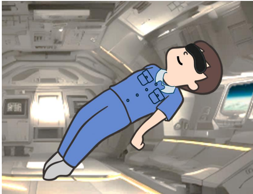
宇宙ミッション(イメージ)

宇宙飛行士が長期滞在中に直面する「睡眠」「リラックス」「匂い」などの課題に着目し、“香りと温もりで整える”新しい入眠体験を宇宙空間で提供するために、各社の技術と知見を結集し、香るカプセルを組み込んだアイマスク製品を開発しました。