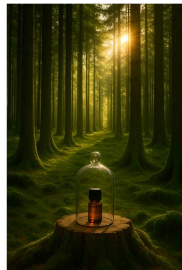
カプセルに封入された香り(イメージ)